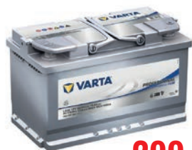
VARTA Professional AGM Dual Purpose 322/353