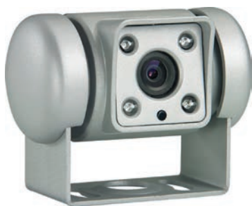
Dometic RFK CAM45 82665E