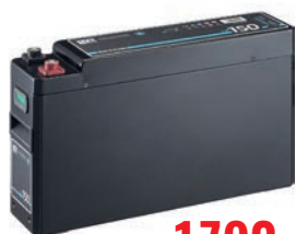
ECTIVE LC 150 SLIM 12V LiFePO4 Lithium Versorgungsbatterie 150 Ah TN4794