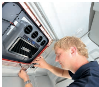
Einbau & Nachrüstung von Zubehör