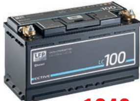
ECTIVE LC 100 BT 12V LiFePO4 Lithium Versorgungsbatterie 100 Ah TN3634