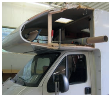
Unfallbeseitigung & Garantieabwicklung