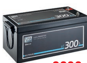
ECTIVE LC 300 L BT 12V LiFePO4 Lithium Versorgungsbatterie 300 Ah TN3639