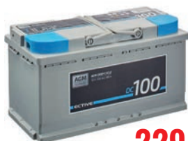
ECTIVE DC 100 AGM Deep Cycle 100 Ah Versorgungsbatterie TN2582