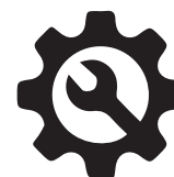
Montage Batterie Standard Ducato 250/290 15 AW