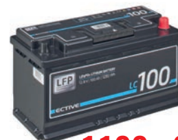
ECTIVE LC 100 12V LiFePO4 Lithium Versorgungsbatterie 100 Ah TN3485