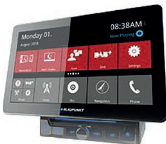
Blaupunkt Camper 990 DAB 82554E