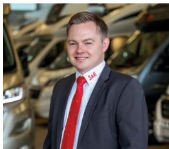
Meisterbetrieb seit 1963