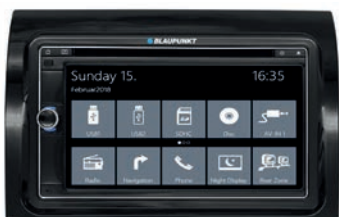
Blaupunkt Camper 690 DAB 82561E