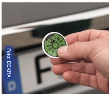
HU, AU* für Caravan & PKW