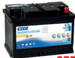
EXIDE Batterie Equipment GEL 322/312