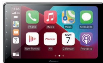
Pioneer Avic-Z1000DAB-C (DUC8) 82542E